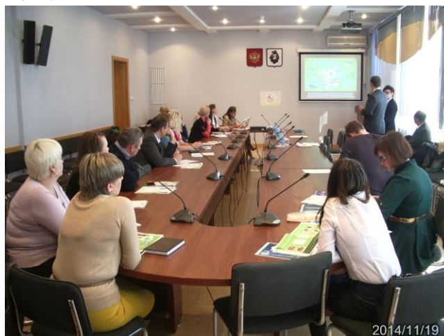
ハバロフスク地方、沿海州でのプレゼンテーション①