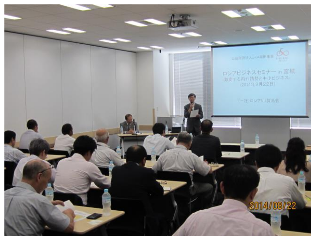
ロシアビジネスセミナー in 宮城 -激変する内外情勢と中小ビジネス-