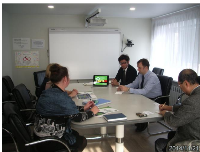
ハバロフスク地方、沿海州でのプレゼンテーション②