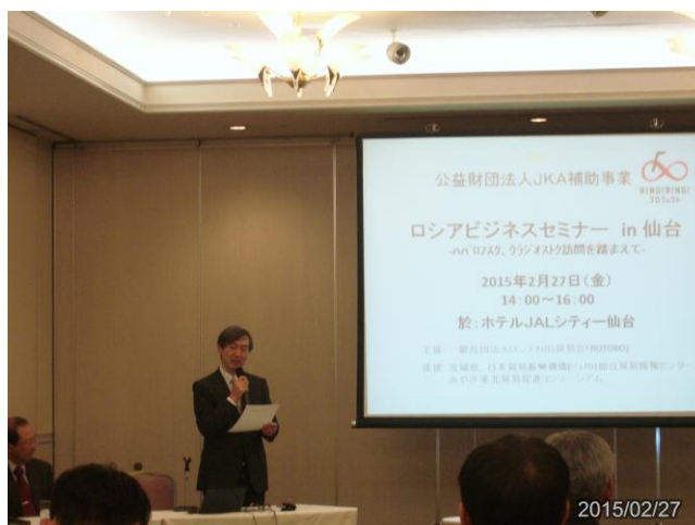
ロシアビジネスセミナー in 仙台 -ハバロフスク、ウラジオストク訪問を踏まえて-